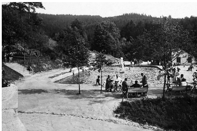
Odpoledne u bazénu.