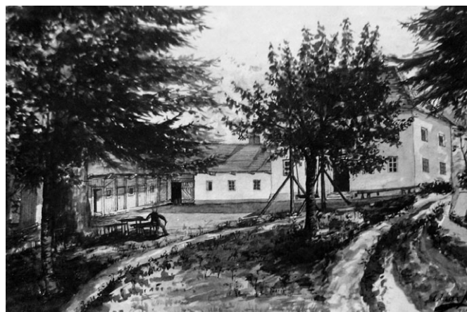
Původní Lázně Andělka na akvarelu od O. Nečase.