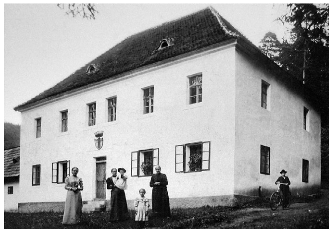
Budova lázní, bývalá hájovna. Dnes obytný dům.

I když dnes mnoho památek na zlatou éru Lázní Andělka nenajdeme, stojí zato někdejší oblíbenou výletní trasu projít a užít si krásné jarní přírody.