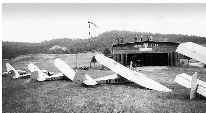
Letovické letiště kolem roku 1956.