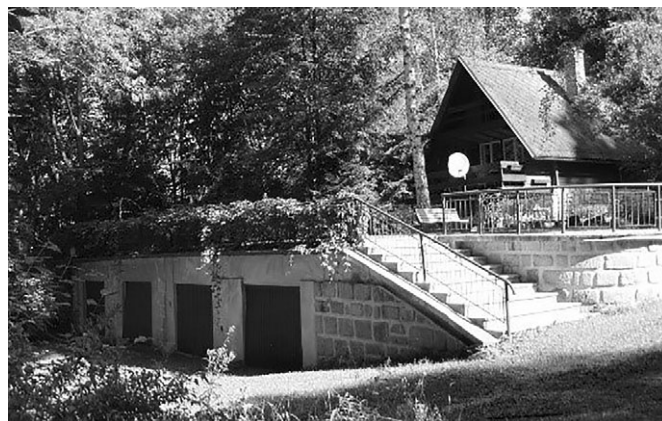
Z lázeňské budovy dnes zůstal suterén.