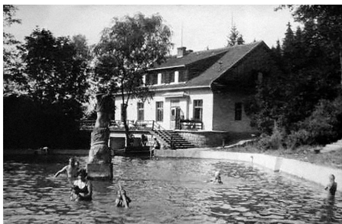
Snížená lázeňská budova, bazén se sochou vodní víly.