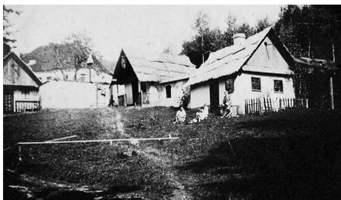
Kulisy vesničky ke hře Jánošík, sehrané 17. srpna 1930. Představení se zúčastnil i autor Jiří Mahen.