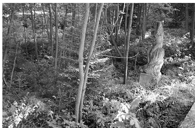
Socha vodní víly.